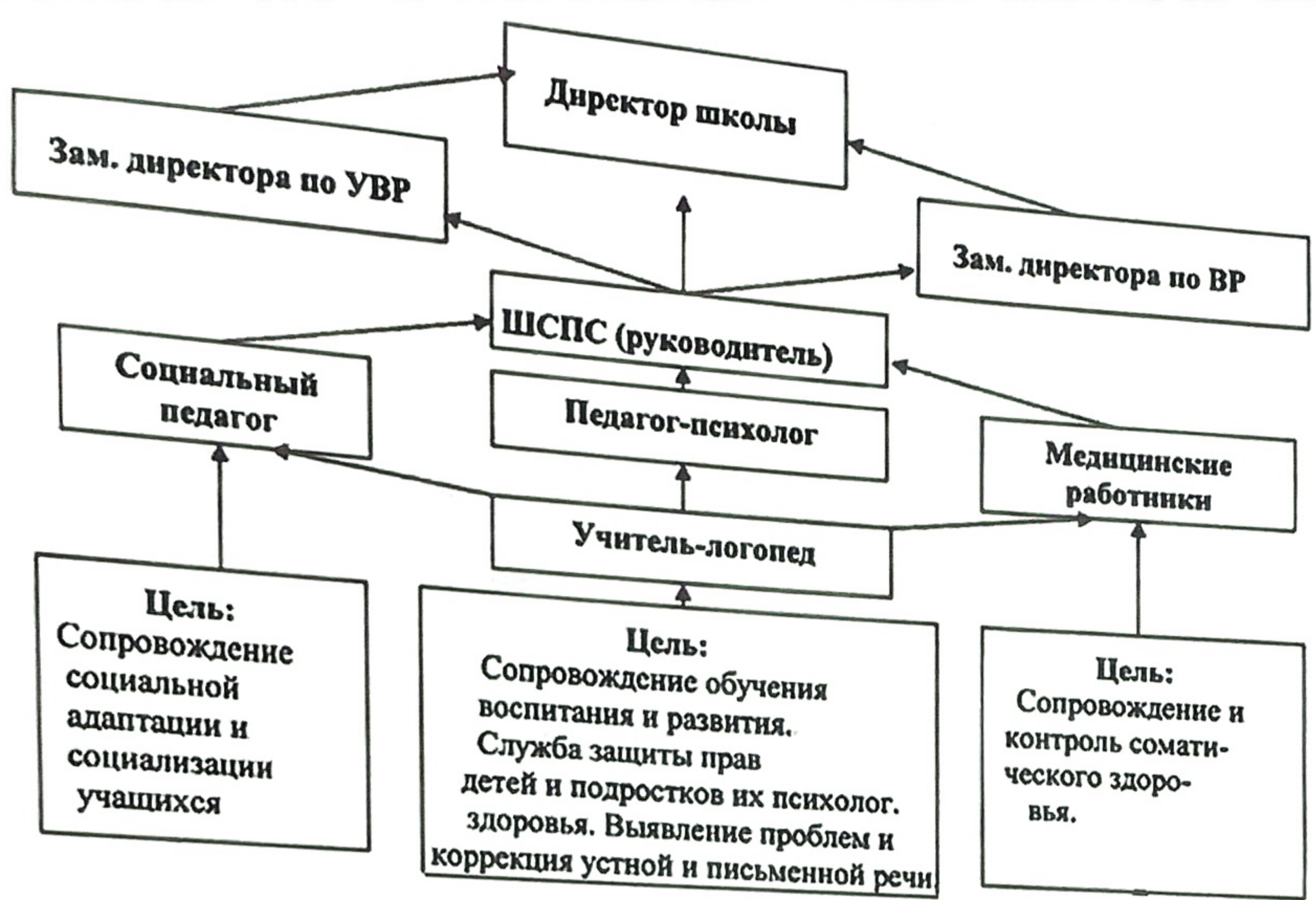
Рисунок 1 – Модель социально-психологической службы МАОУ СШ №